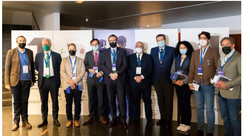
Caja Rural, Junta de Andalucía y Universidad de Jaén