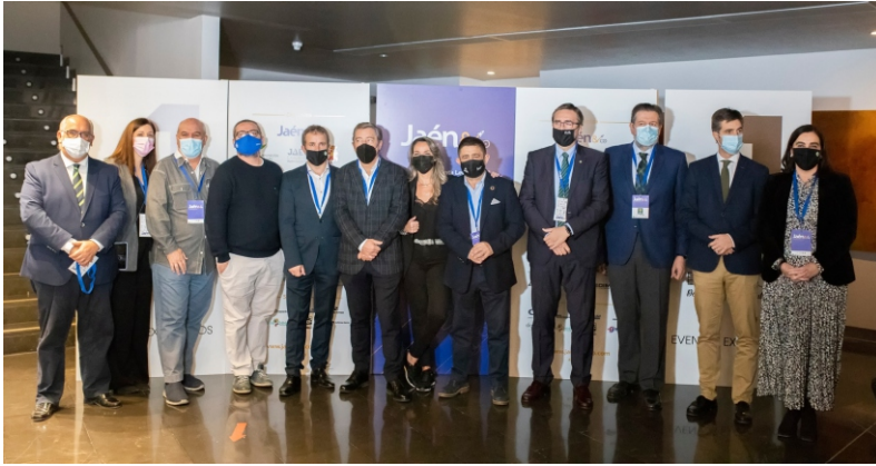
Photocall Socios Principales junto a Diputación Provincial